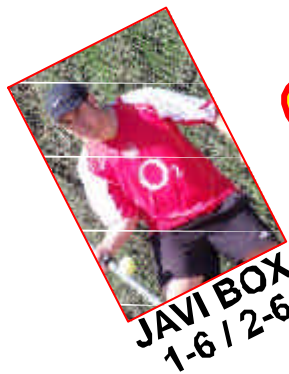
JAVI BOX 1-6 / 2-6