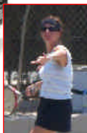
FINI 3-6 / 2-6